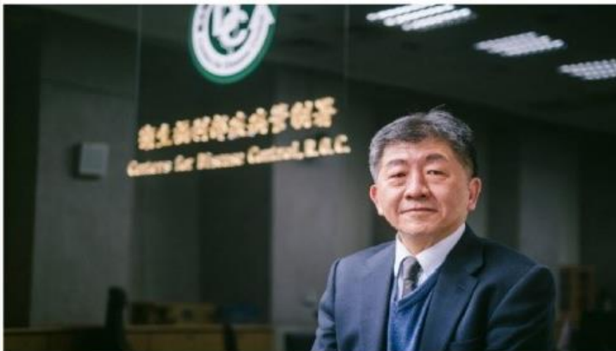
陳時中 台湾衛生福利部長(衛生相)